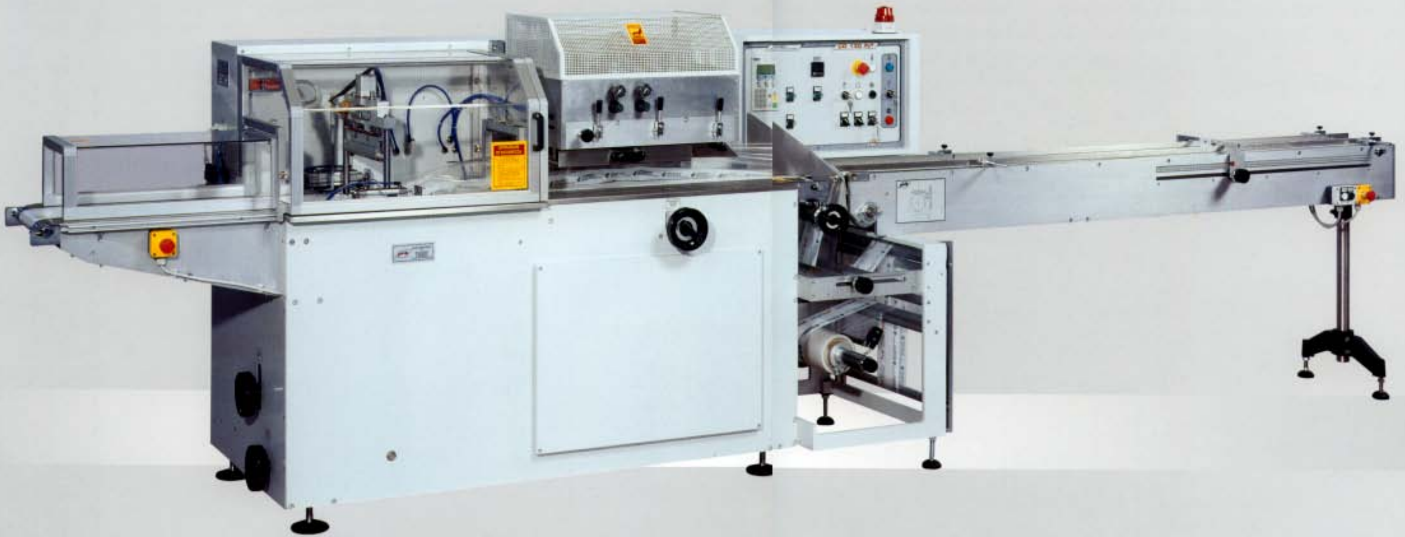
“CO 130 Int” Horizontal Wrapping Machine