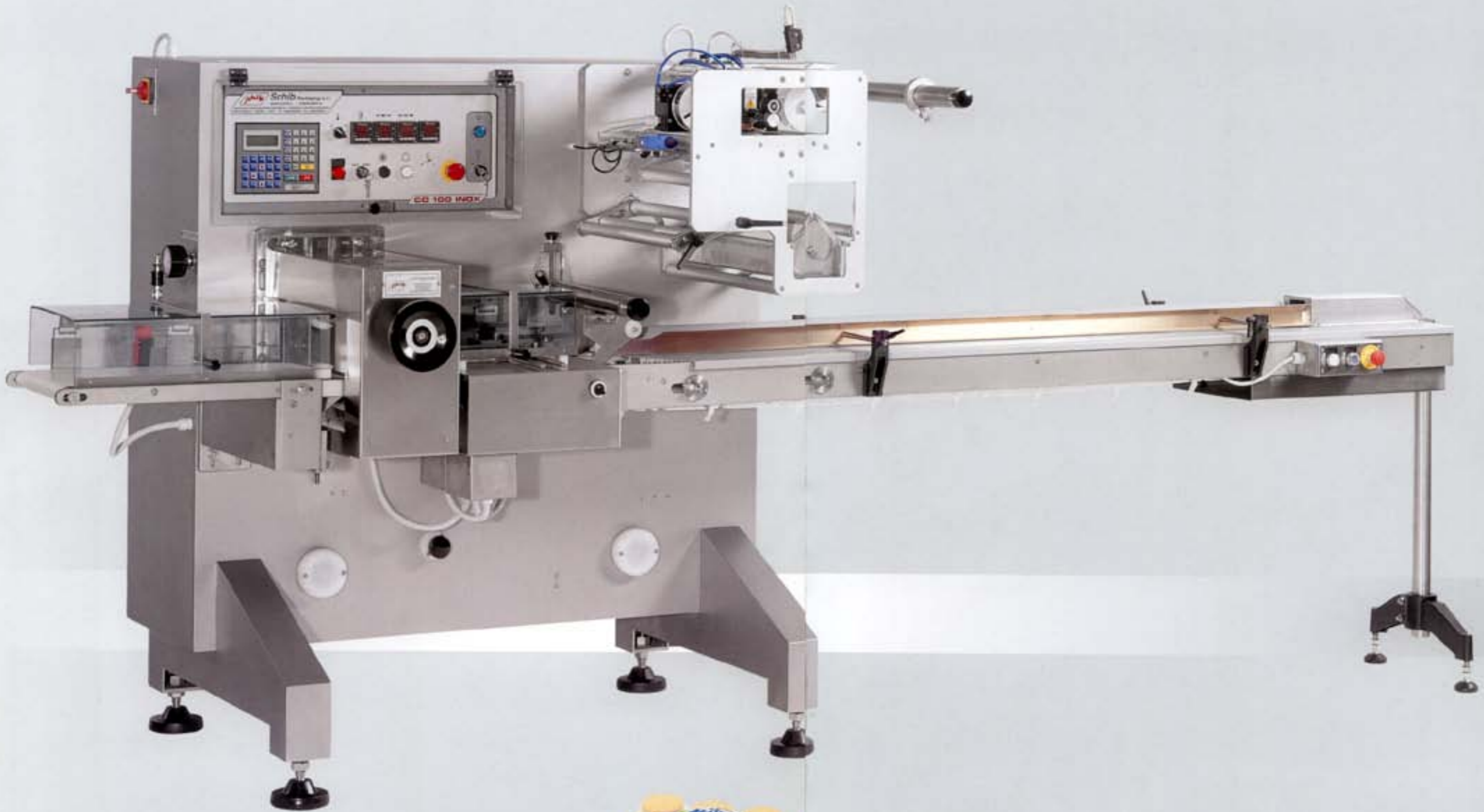
“CO 100 Inox” Horizontal Wrapping Machine