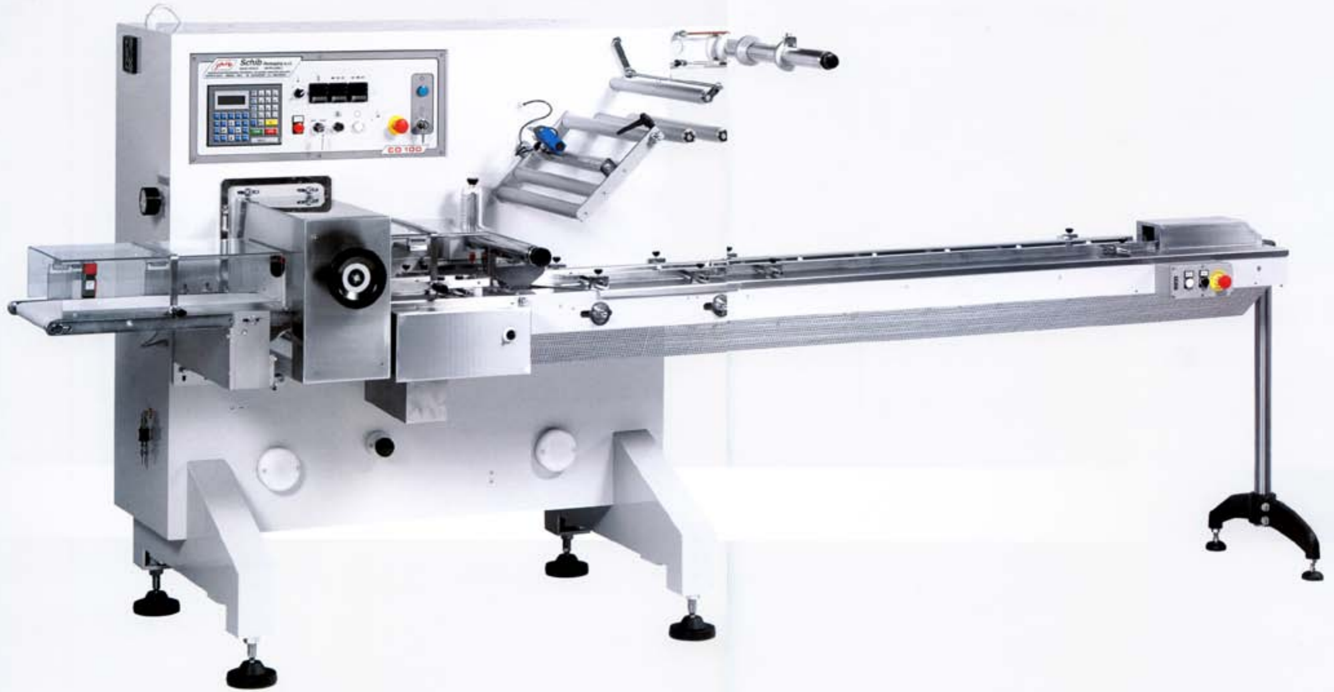
“CO 100” Horizontal Wrapping Machine